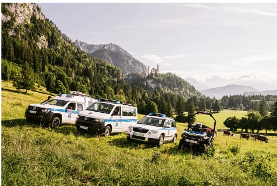
Ein Blick auf den Fuhrpark der Bergwacht Füßen