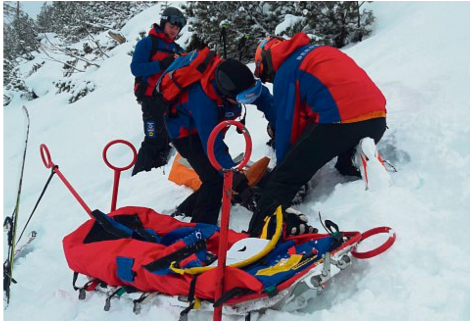
Das Bild zeigt die Bergwachtler bei einem Übungszenario einer Versorgung neben der Skipiste.